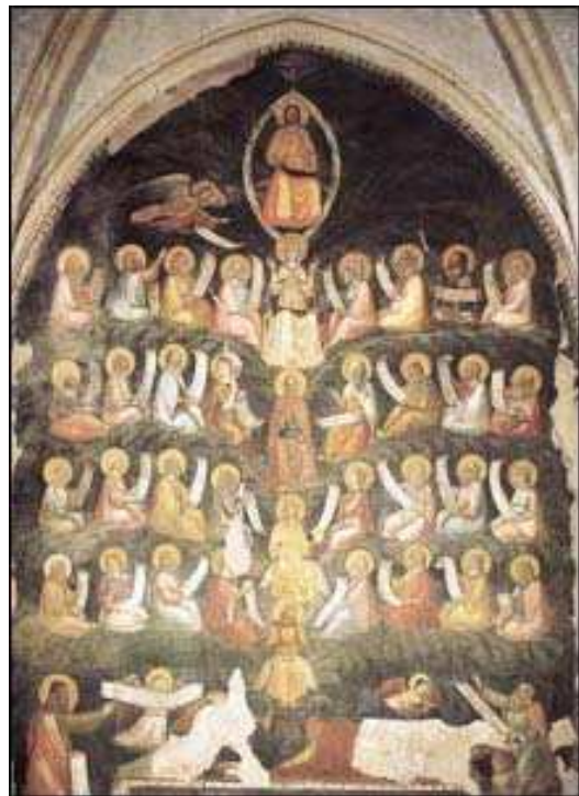
Genealogia di Gesù Matteo 1, 1-17; Luca 3, 23-38