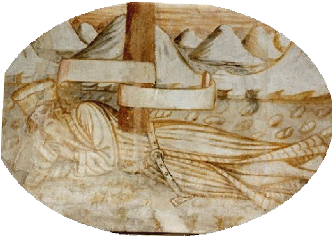
Rappresentazione dell'Albero Genealogico di Cristo. La persona coricata è Jesse.

Con la potenza de Nome di Gesù, del suo Sangue, del Suo Amore infinito che incessantemente ascolta la nostra preghiera, queste anime possono trovare liberazione e incamminarsi verso la casa del Padre, entrare a far parte della Comunione dei Santi, che porta benedizione alla nostra vita. Questo porterà sicuramente beneficio alla nostra vita in maniera più o meno evidente e, soprattutto, spezzerà quella catena che si trasmette di generazione in generazione.