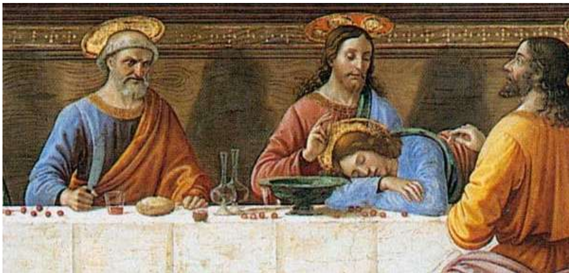
Con Gesù ci sono il discepolo che egli amava, Pietro e Giuda

Nel Vangelo di Giovanni non c'è il "trio: Pietro, Giacomo e Giovanni", ma il "duo: Pietro e il discepolo, che Gesù amava". Non si sa chi sia questo discepolo. La tradizione lo riconosce come Giovanni stesso; in realtà è sempre anonimo. È l'esempio del vero discepolo, di colui che davvero segue Gesù, è a tavola con Gesù, è chino sul suo petto, in comunione, in intimità; lo segue nella casa del Sommo Sacerdote: entra ed esce liberamente. È ai piedi della Croce in piena condivisione.