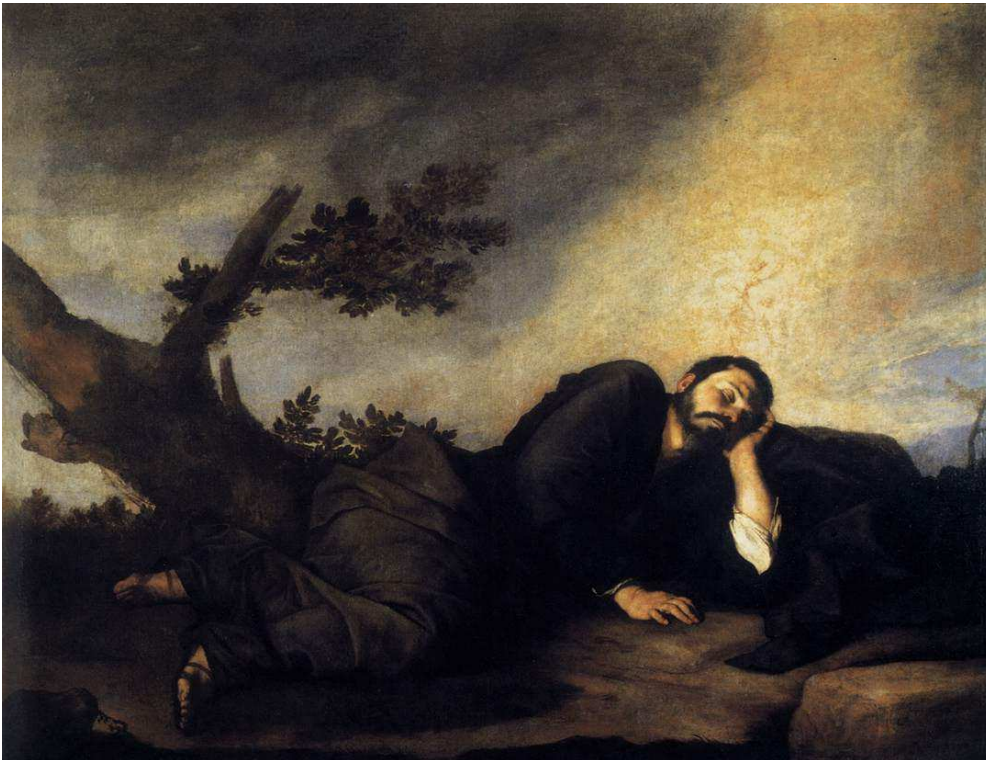
Giacobbe sogna- Josè Ribera- Museo Del Prado

Capitò così in un luogo, dove passò la notte, perché il sole era tramontato; prese una pietra, se la pose come guancia e si coricò in quel luogo. Fece un sogno: una scala poggiava sulla terra, mentre la sua cima raggiungeva il cielo; ed ecco gli angeli di Dio salivano e scendevano su di essa. Ecco il Signore gli stava davanti e disse: «Io sono il Signore, il Dio di Abramo tuo padre e il Dio di Isacco. La terra sulla quale tu sei coricato la darò a te e alla tua discendenza. La tua discendenza sarà come la polvere della terra e ti estenderai a occidente e ad oriente, a settentrione e a mezzogiorno. E saranno benedette per te e per la tua discendenza tutte le nazioni della terra. Ecco io sono con te e ti proteggerò dovunque tu andrai; poi ti farò ritornare in questo paese, perché non ti abbandonerò senza aver fatto tutto quello che t'ho detto». Allora Giacobbe si svegliò dal sonno e disse: «Certo, il Signore è in questo luogo e io non lo sapevo». Ebbe timore e disse: «Quanto è terribile questo luogo! Questa è proprio la casa di Dio, questa è la porta del cielo».